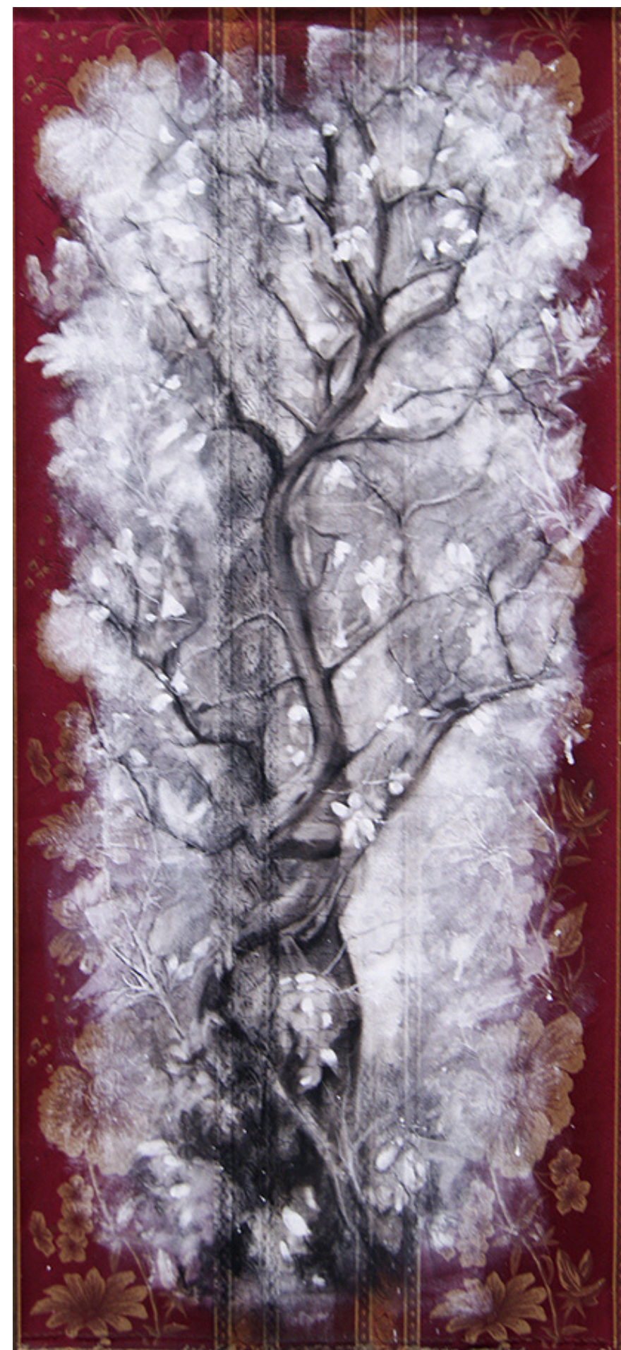
“DRÍADE PROTECTORA” / 2024 Estandarte, mixta / tela de tapicería 55” X 20 ½” $ 750 dls