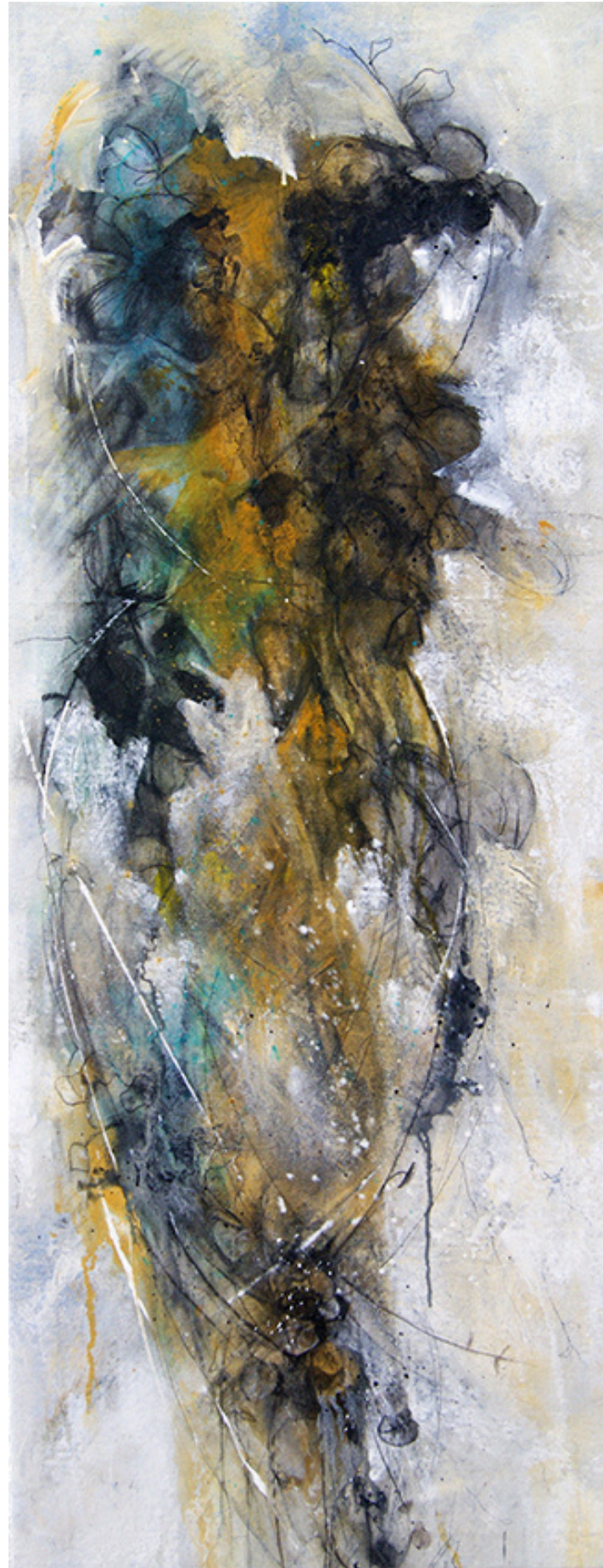
24 "COLGANTES" / 2023 Carboncillo, grafito y acríco / tela 45" X 17 ½" $ 650 dls