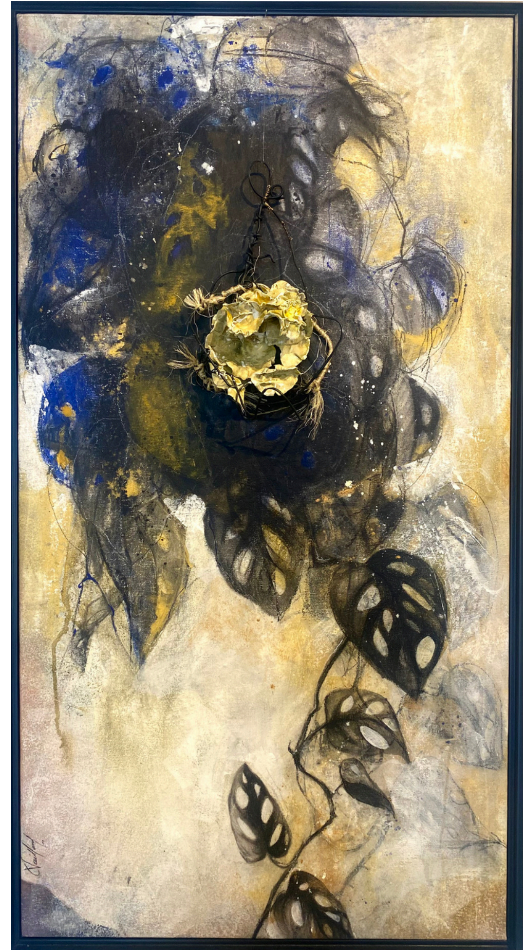
25 "SUSPENDIDAS" / 2023 Carboncillo, grafito y acrílico y cerámica / tela 39" X 21" $ 800 dls