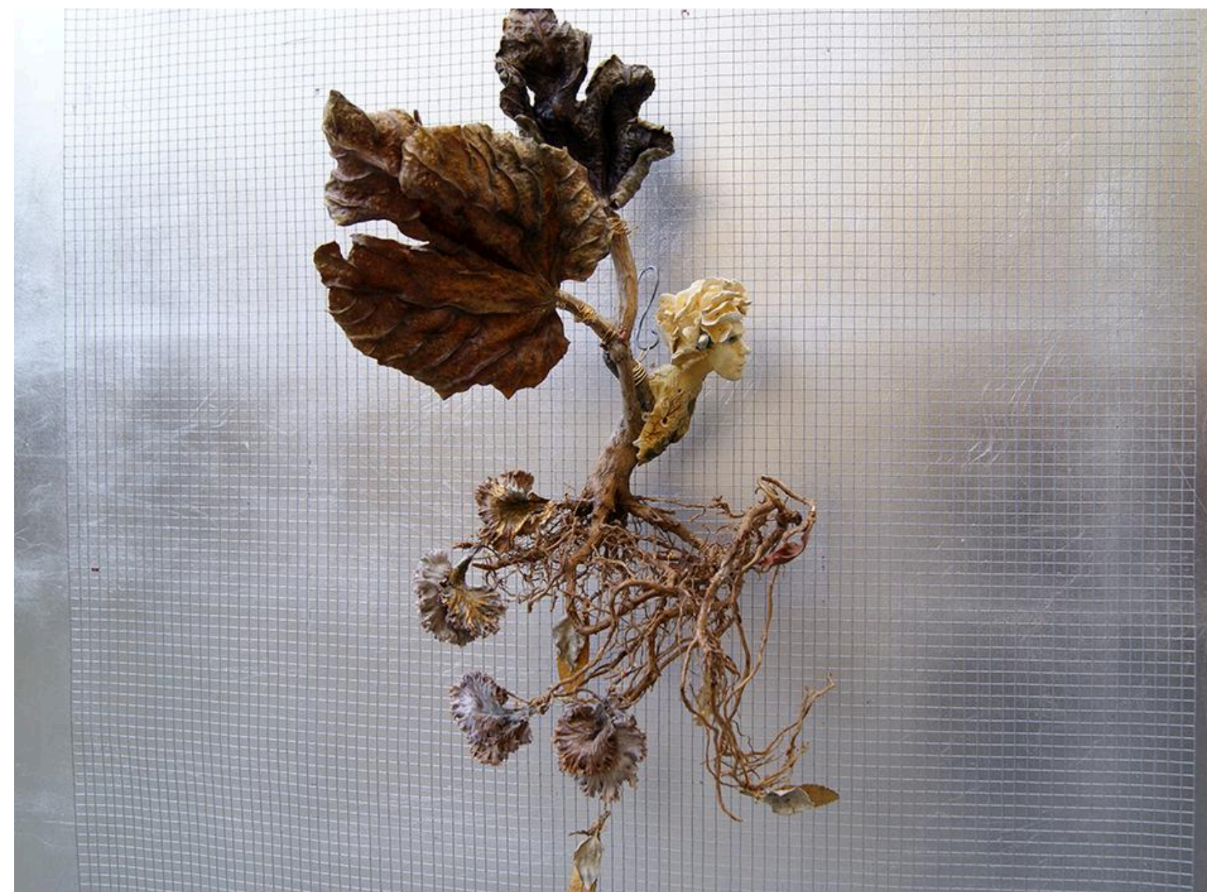
“ESTO NO ES UN BONSAI” / 2023 Material orgánico / madera 39” X 23 ½” $ 500 dls