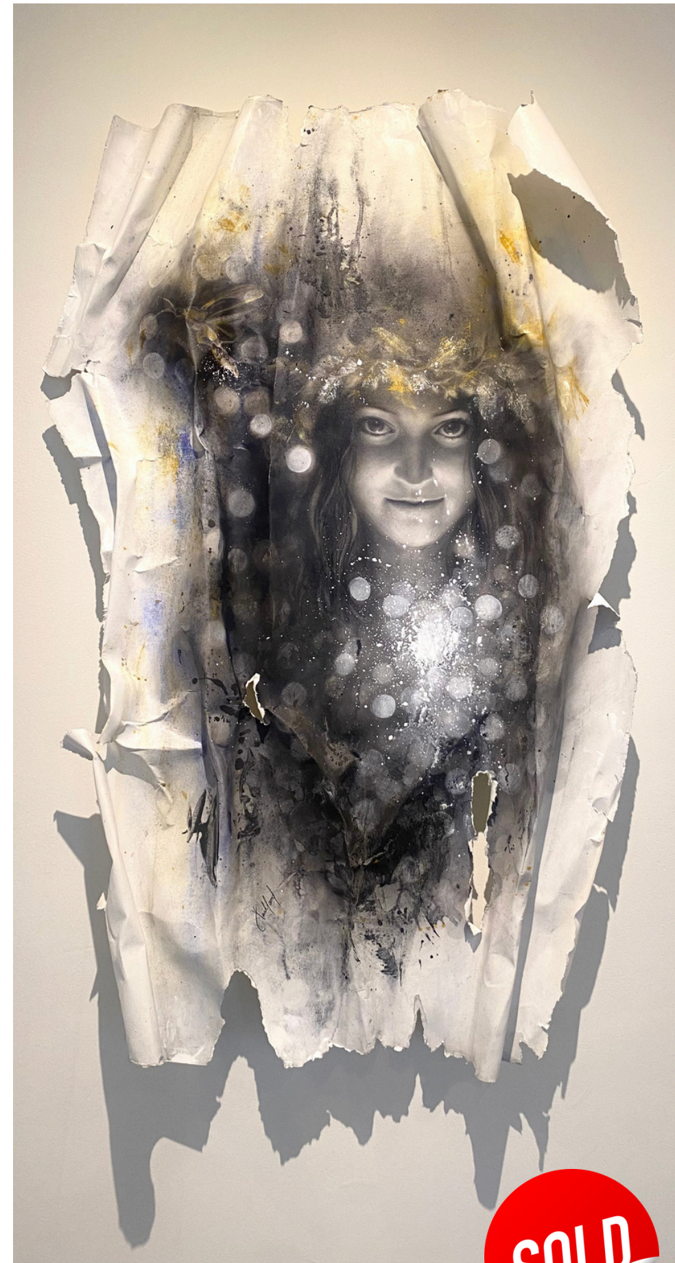
“ESPÍRITU GUARDIÁN” / 2024 Carboncillo y acrílico / papel Arches 43” X 27” $ 1000 dls