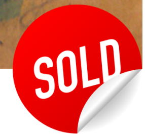
“PEONÍAS” / 2023 Acrílico y carboncillo en papel kraft / madera 39" X 24" $ 950 dls