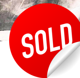
“REFUGIO II” / 2024 Grafito, acrílico / papel 19” X 22” $ 400 dls