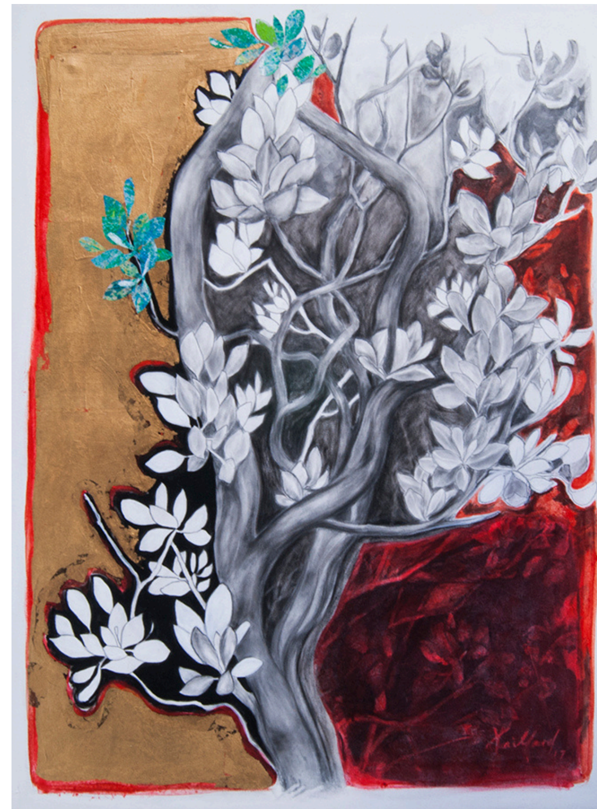
“MANZANITA II” / 2023 Carboncillo, grafito y acrílico / madera 26 1/2” X 17 1/2” $ 700 dls