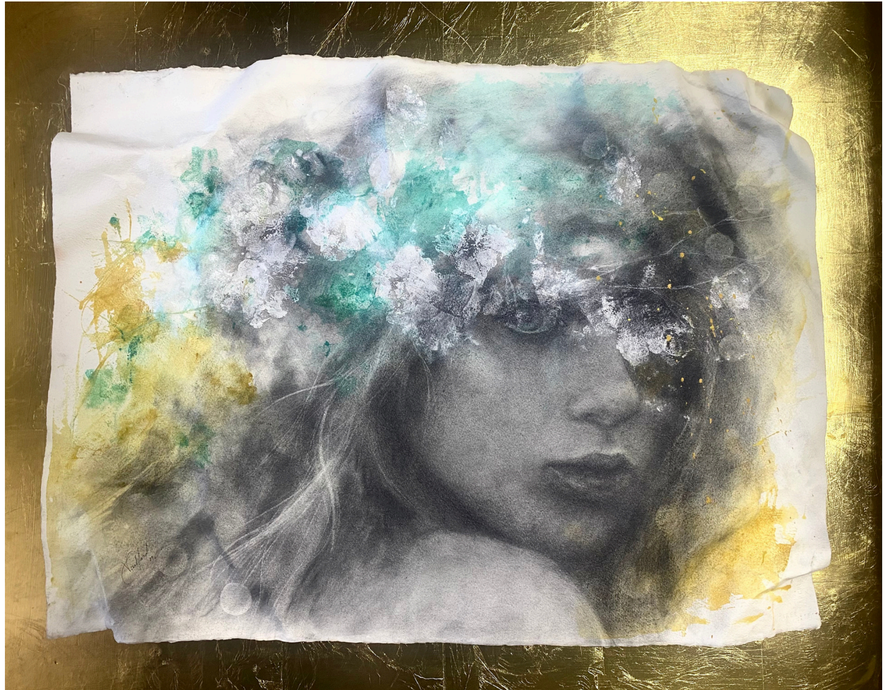
“VIGILANTE” / 2025 gcarboncillo y acrilico / tpapel $ 400 dls