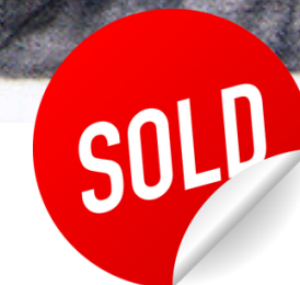
“REFUGIO” / 2023 Grafito, papel, material orgánico / tela 24” X 24” $ 800 dls