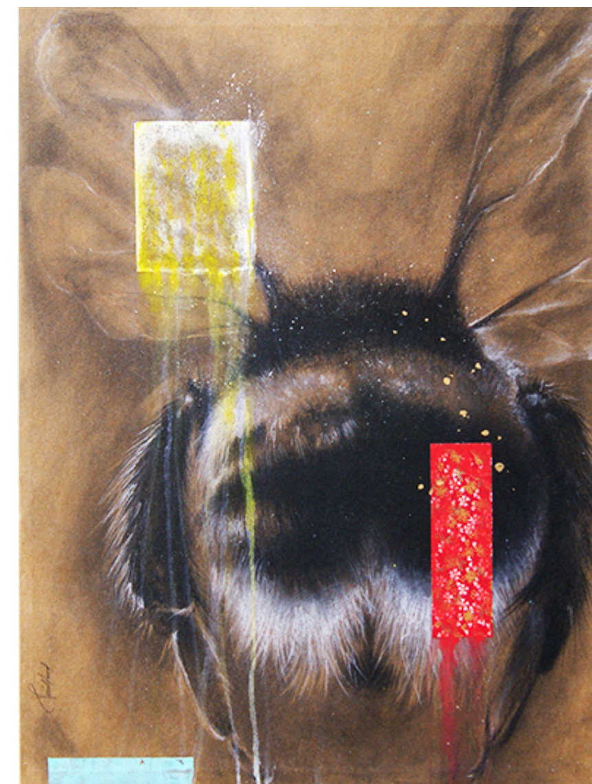
“ZUMBIDO VITAL” / 2023 Grafito, carboncillo y acrílico / tela 24” X 24” $ 500 dls