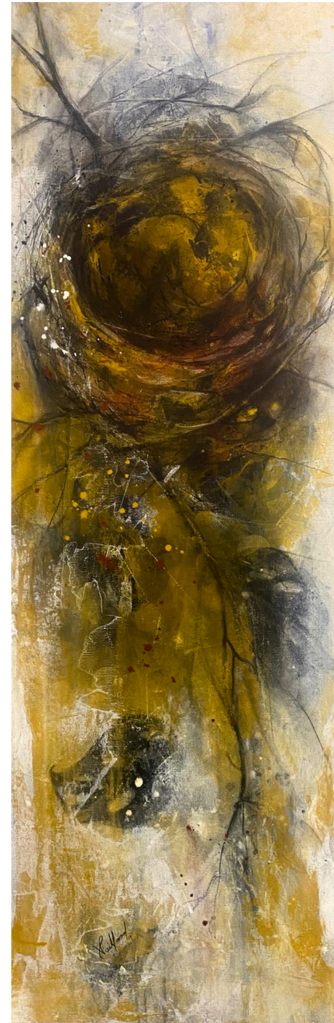
"ORIGEN" / 2024 Carboncillo, acrílico y cerámica / tela 32" X 12" $ 400 dls