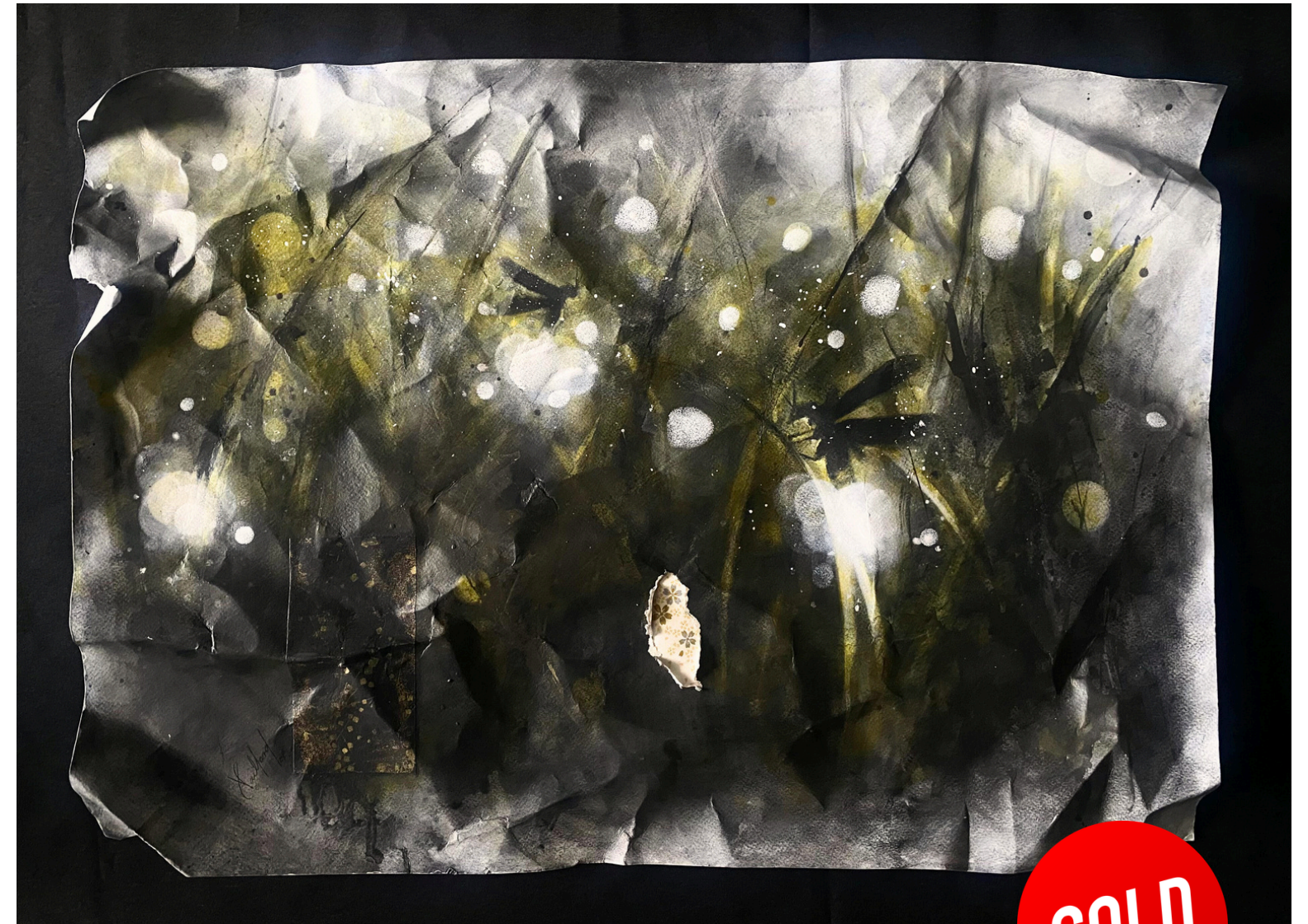
“SUCULENTA” / 2015 Carboncillo, papel y arenas / tela 39” X 35” $ 950 dls